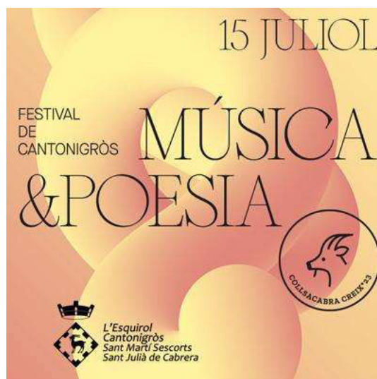
Figura 6. Evento del Festival de Música i Poesia de Cantonigròs.