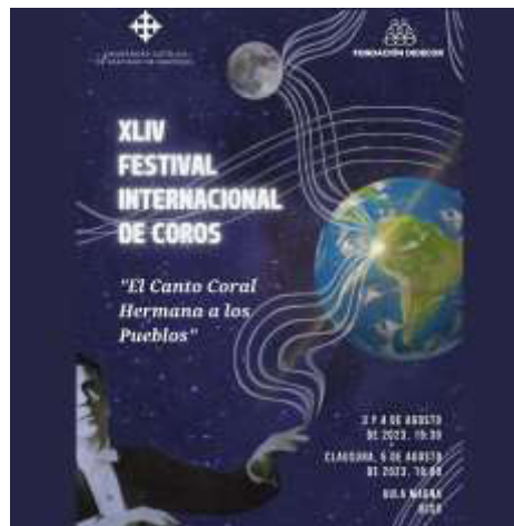
Figura 5. Otra imagen de ejemplo desde Facebook. Nota. Tomado de Facebook.com, s/f, recuperado el 23 de agosto de 2023. https://www.facebook.com/photo?fbid=1025301592119050&set=pcb.1025301662119043 .

En Guayaquil, el afiche del Festival Internacional de Coros "El canto coral hermana a los pueblos" destaca por su modernidad y elegancia, combinando la música con un toque cósmico y galáctico. Mientras que, en Barcelona, el Festival Internacional de Música de Cantonigròs opta por una estética más vanguardista y minimalista, utilizando la clave de sol en una representación 3D y contra poniéndola con una tipografía sutil, lo que crea un efecto contrastante y contemporáneo.