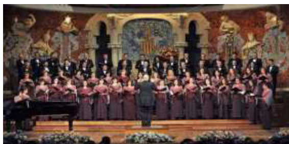
Figura 2. Imagen referente al Simposio Mundial de Canto Coral en Barcelona. Nota. Tomado de "Barcelona acoge el Simposio Mundial de Canto Coral, 50 conciertos en una semana" por A. Huerta, 2017, El Imparcial. https://www.elimparcial.es/noticia/179860/cultura/barcelona-acoge-el-simposio-mundial-de-canto-coral.html .