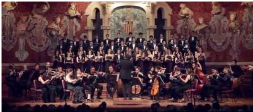
Figura 8. Interpretación del Magnificat por Cor Jove de l'Orfeó Català. Nota. Tomado de "Bach: Magnificat / 1. Magnificat, anima mea" por D. Esteve Nabona [@EsteveNabonaDirector], 2016, Youtube. https://www.youtube.com/watch?v=T7b3qFo6xNM .