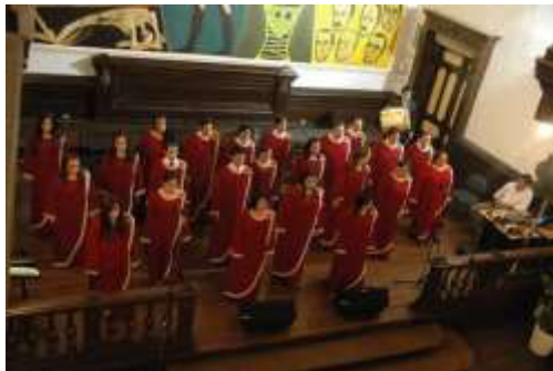
Figura 1. Coro de la Casa de la Cultura Núcleo del Guayas. Nota. Tomado de "Ecuador" por el Coro de la Casa de la Cultura Núcleo del Guayas, 2013, Pinterest. https://nl.pinterest.com/pin/469711436106882472 .

En Guayaquil, la ciudad se destaca por su apoyo activo al canto coral, principalmente a nivel educativo y cultural. Esta dedicación resuena en cómo se promociona y valora el canto coral, demostrando una conexión íntima con la tradición y cultura local. Barcelona, por otro lado, es conocida internacionalmente por su rica diversidad en el ámbito musical y artístico. Esta amplitud se refleja en su prominencia en actividades corales en el ámbito internacional, ofreciendo un espectro más amplio de influencias y colaboraciones.