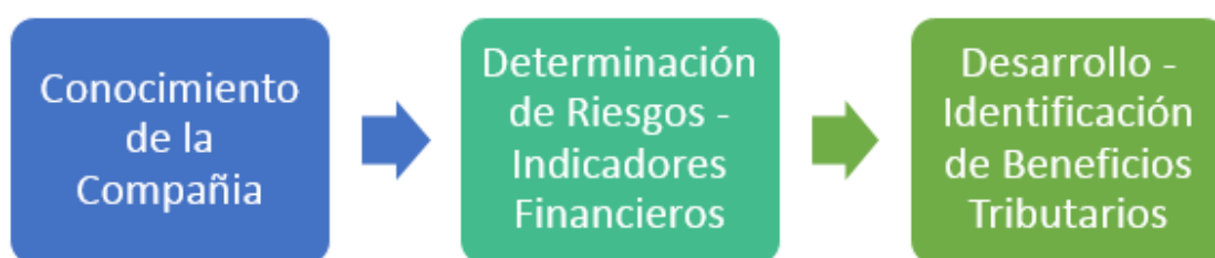
Figura 3 Planificación Tributaria a la empresa TRANSPORTES ROCHA CIA. LTDA.

Nota. La figura 3 muestra la propuesta para Transportes Rocha CIA. LTDA.