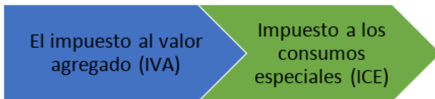
Figura 2 Clasificación de los impuestos indirectos

Nota. La figura 2 indica la clasificación de los impuestos indirectos.