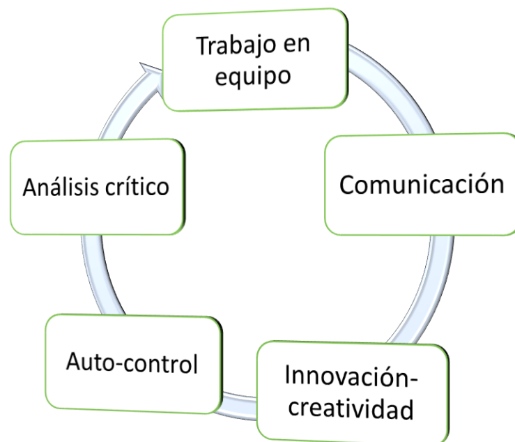
Ilustración 2 Habilidades necesarias en el Siglo XXI

Por lo antes expuesto surge un gran desafío para los Docentes, quienes deben identificar y aprovechar las oportunidades que brindas distintas estrategias metodológicas como el ABP (aprendizaje basado en proyectos), estudio de casos y juego de roles. Metodologías que son propuestas en el presente modelo pedagógico con el propósito articular la teoría y la práctica, perfeccionar el accionar docente dentro del aula de clase y contribuir al desarrollo de habilidades blandas en los estudiantes.