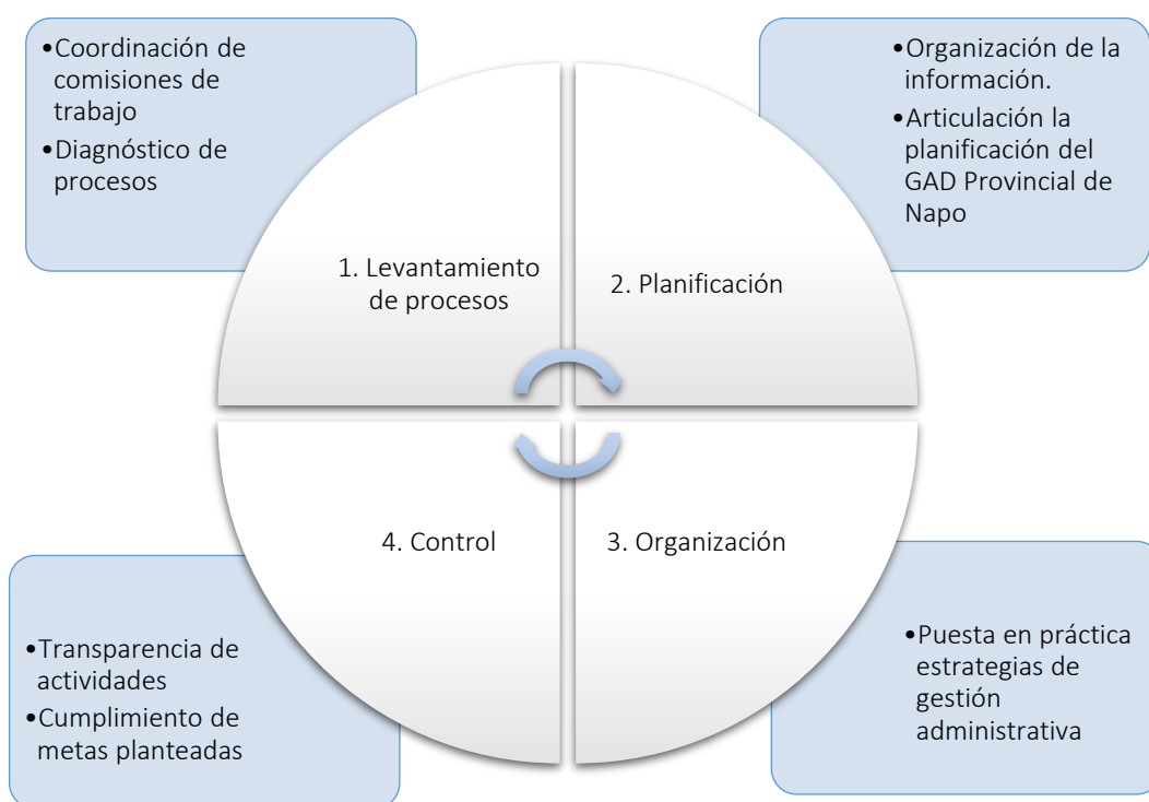
Figura 3 Organizador de la propuesta Modelo de gestión para la administración y control de recursos

En la figura 3, se plantea la estructura general de la propuesta del Modelo de gestión para la administración y control de recursos del GAD Provincial de Napo. Dentro del levantamiento de procesos se establece la coordinación de comisiones de trabajo y el diagnóstico de procesos, a través de cual se pretende que la institución de análisis cuente con información actualizada para la toma de decisiones, para ello se centra en la recolección de datos sobre la población que se encuentra dentro de su jurisdicción, al igual que, el proceso administrativo para mejorar la calidad de los servicios. Dentro del segundo enfoque que implica la planificación donde se realizará la organización de la información que se obtenga en la fase anterior y se realizará una