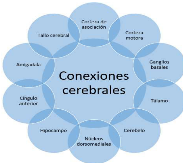
Gráfico 2. Conexiones cerebrales de las FE.

Los componentes de las FE trabajan de manera interdependiente y, cada uno de ellos son los responsables parcialmente de la función ejecutiva general, constituidas por elementos básicos o primarios y auxiliares. (ver gráfico N. 3).