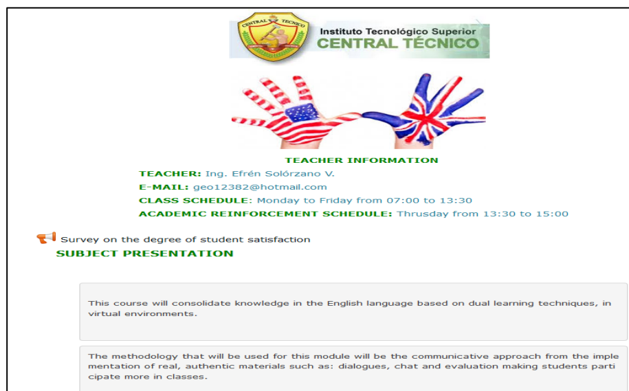
Figura 1. Información en la plataforma.

Al hacer uso de las TIC en el proceso de enseñanza aprendizaje del idioma inglés, el docente debe interactuar adquiriendo competencia comunicativa, es decir, facilitando por medios de instrumentos tecnológicos la interacción digital, cuyo objetivo será el de orientar la comunicación virtual enmarcado en el proceso, obteniendo resultados que mejoren la comunicación docente-estudiante y favorecer una significativa contribución en el aprendizaje dual.