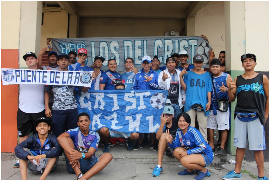
Fuente: Imagen 2 barristas de Boca del Pozo. Elaboración propia.