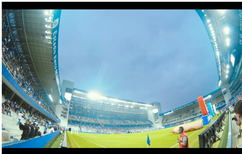
Fuente: Imagen 10 Estadio. Elaboración propia