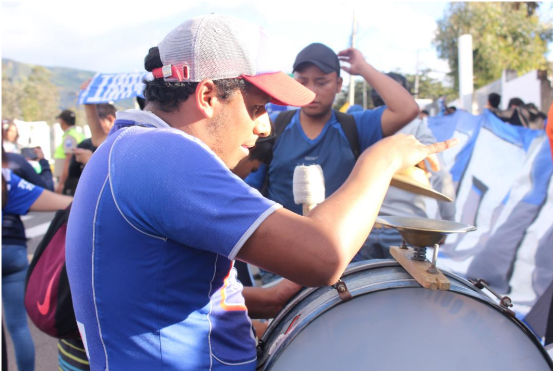
Fuente: Imagen 4 barrista de Boca del Pozo. Elaboración propia

Luego de comprender cómo el estudio de la identidad grupal puede ayudar a comprender el fenómeno de las barras bravas en el fútbol, es preciso destacar que su estudio requiere de reconocer categorías de investigación acordes al tema tratado.