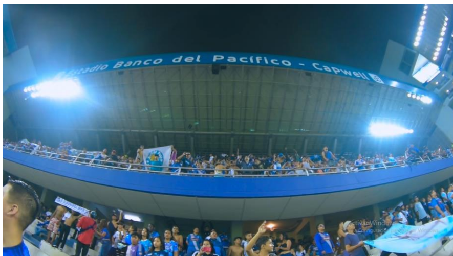
Imagen 14 Barra Boca del Pozo.

Sus formas de actuación en el contexto deportivo son positivas y generan un ambiente de alegría y entusiasmo. Si bien existe un estereotipo de violencia en relación a las barras bravas, puede concluirse que no necesariamente es un comportamiento dominante ni presente en todo momento entre los integrantes de la Boca del Pozo, ni lo que se refleja en el documental, más bien se dejan ver como fanáticos apasionados por su club, con un fuerte sentido de pertenencia y lealtad hacia el equipo de fútbol. El documental muestra el ambiente en el cual viven y transitan los hinchas.