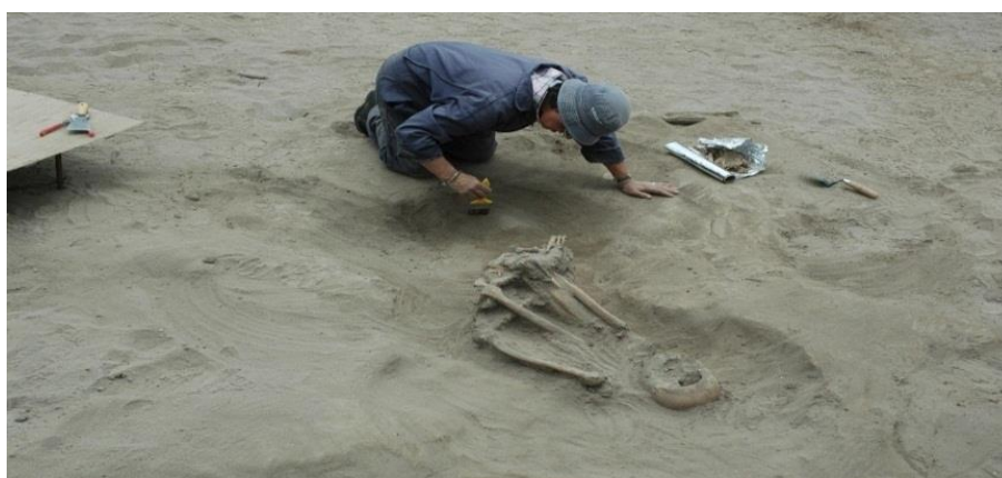
Figura 5 Posiciones de Cámara

Posición Normal. El sujeto u objeto debe estar de frente o paralelo de la cámara. (Massucco, 2005) Por esta razón la mayor parte de imágenes que tiene el libro son tomados de esta manera. Una de estas imágenes es Santa Mariana de Jesús Catequizando. Los cuales se pueden mencionar las obras pictóricas, los entrevistados y esculturas son fotografiados de esta manera.